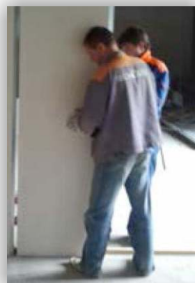
Высокая скорость монтажа