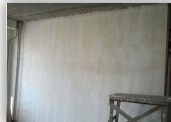
Полная готовность к отделке